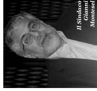
Il Sindaco Gianni Montesel

"Alla necessità di riprendere un dialogo interrotto e favorire una partecipazione attiva ed anche critica della cittadinanza, partendo dalla conoscenza delle attività in cantiere e degli obiettivi che l'Amministrazione Comunale si pone".