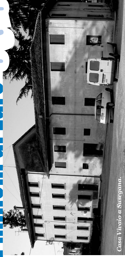
Casa Vivato a Susegana.

I lavori pubblici nel 2005. Tra le priorità la viabilità pedonale e ciclabile a Ponte della Priula, il completamento del Municipio e un centro per anziani e Associazioni.