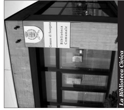
La Biblioteca Civica

La Biblioteca di Susegana ha come scopo primario la diffusione della lettura e della cultura attraverso il prestito delle opere librerie, ma si connota anche come luogo di consultazione (sono a disposizione 3 computer collegati ad Internet ed enciclo-