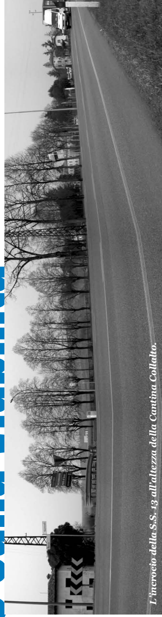
L'incrocio della S.S. 13 all'altezza della Cantina Collalto.

Fin d'ora l'Amministrazione Comunale si scusa per i disagi che gli interventi migliorativi della viabilità sulla Statale 13 Pontebbana arrecheranno ai cittadini, nella certezza che, una volta ultimata, l'opera porterà sicuri benefici a tutta la comunità.