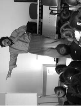
Letture creative in Biblioteca.

La Biblioteca suseganesa è dotata di arredi nuovi e moderni, di un ufficio accogliente; è ben illuminata e climatizzata. C'è inoltre una sala riunioni che è a disposizione dell'associazioneismo locale a cui è possibile accedere previa domanda scritta e successiva consegna delle chiavi del locale, che può ospitare una cinquantina di persone.