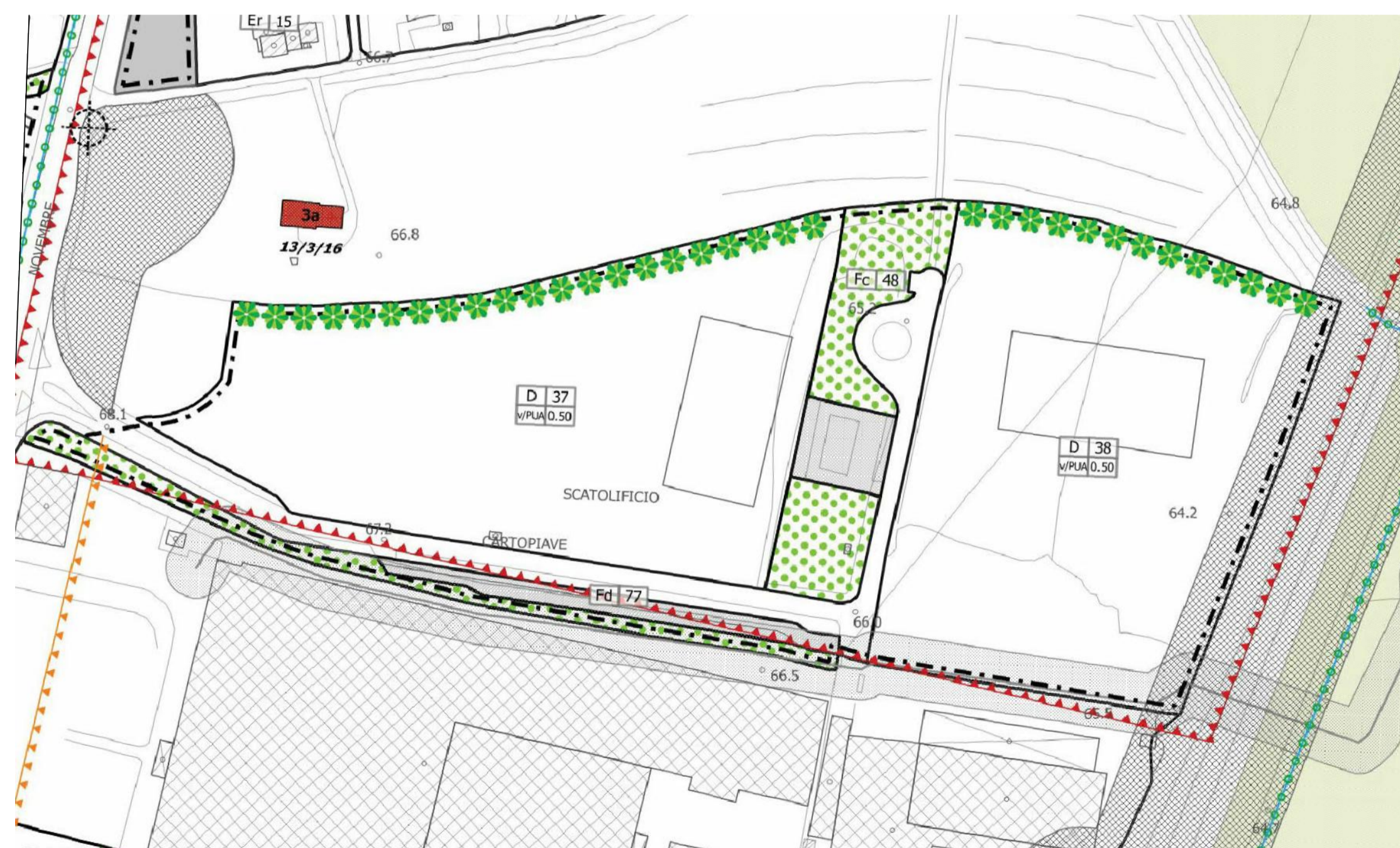
ESTRATTO DA P.I. scala 1:2.000

— PERIMETRO DI PROPRIETA' AMBITO DI LOTTIZZAZIONE