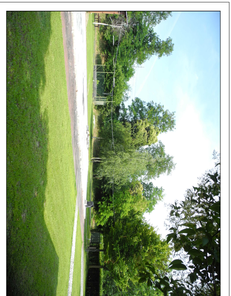
Cono Visuale 3