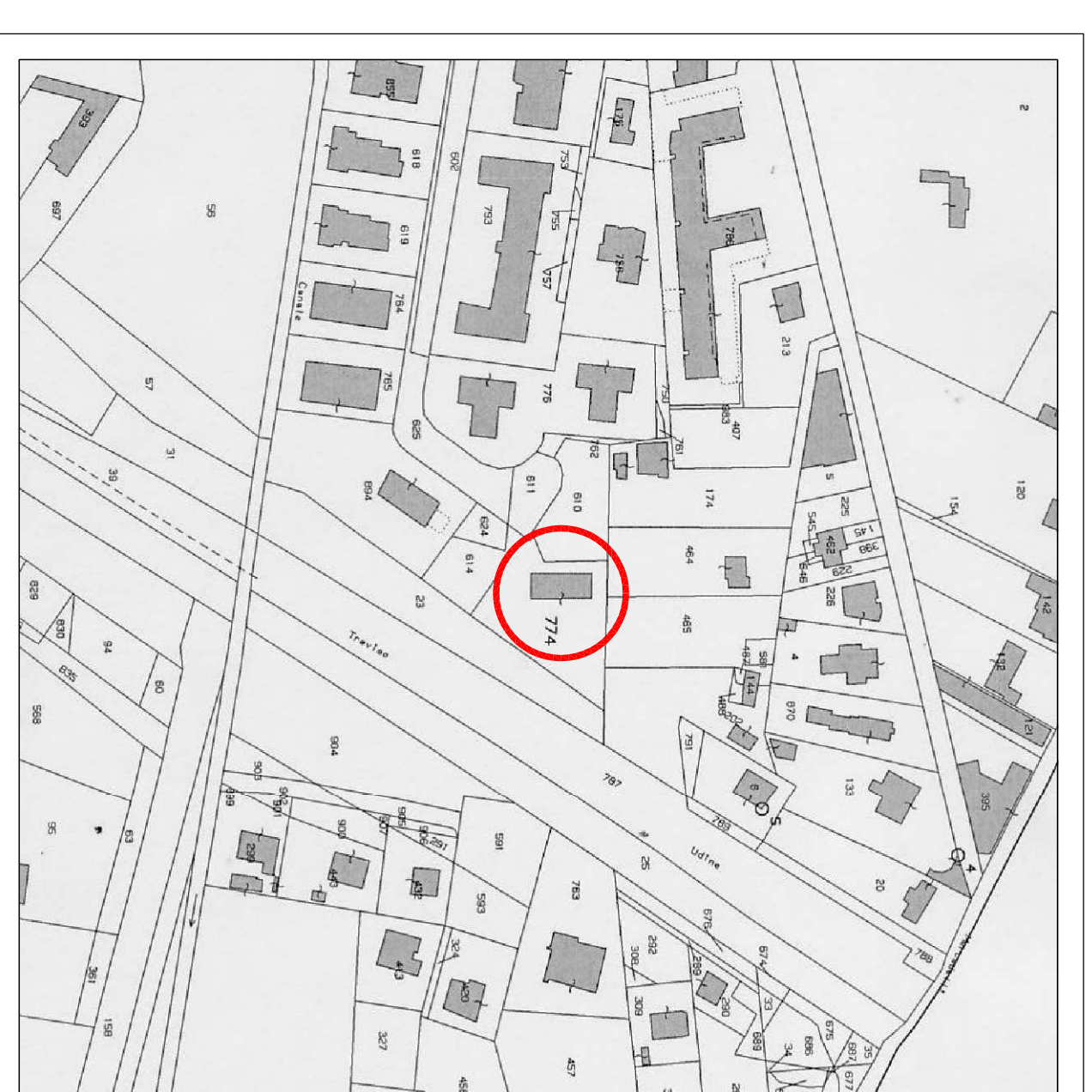
ESTRATTO DI MAPPA - sc: 1:2000 Comune di Susegana Foglio n. 45 - Mappali n. 610 - 774