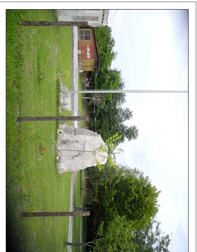
Cono Visuale 4