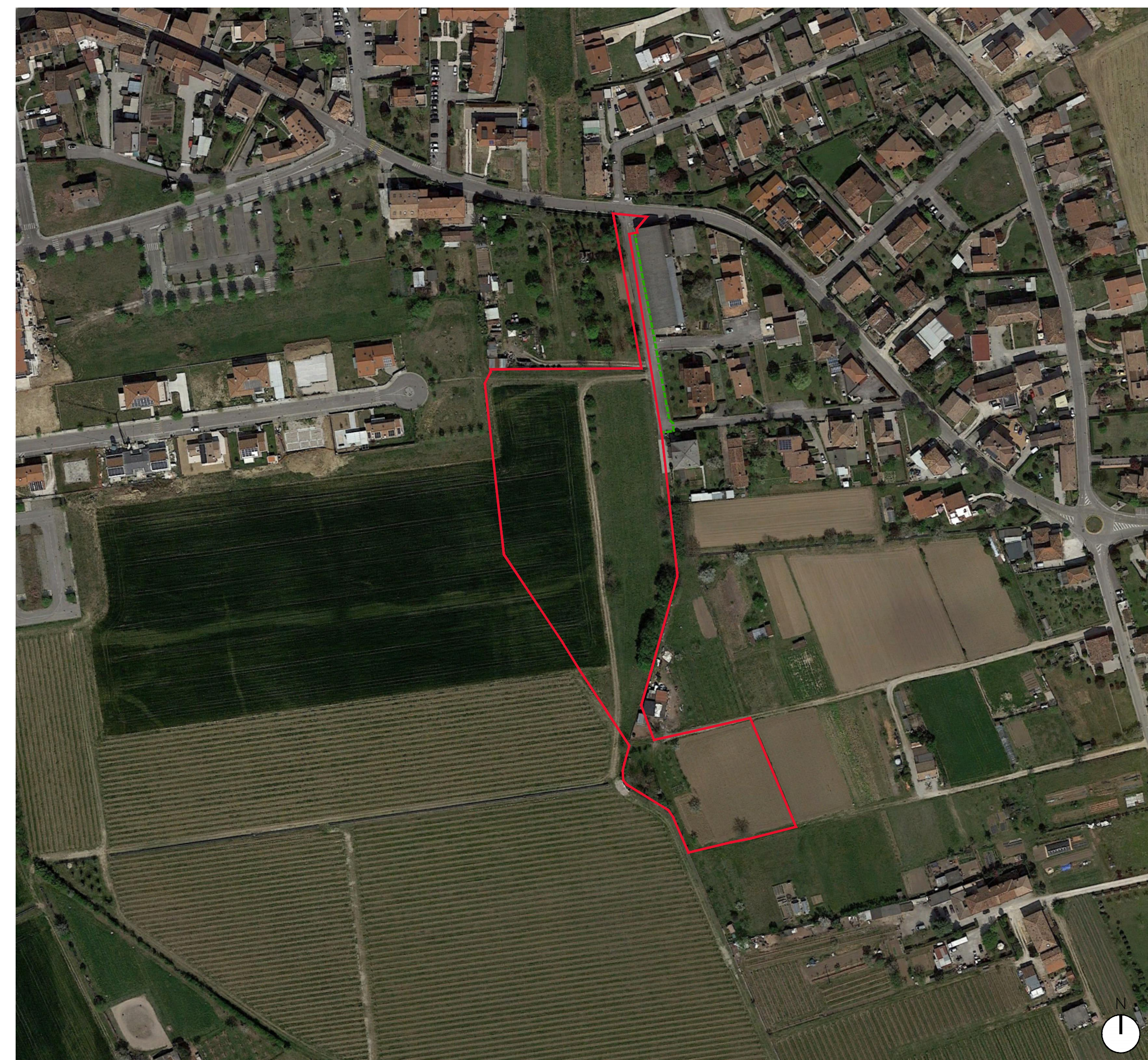
Estratto ortofotopiano - scala 1:2.000